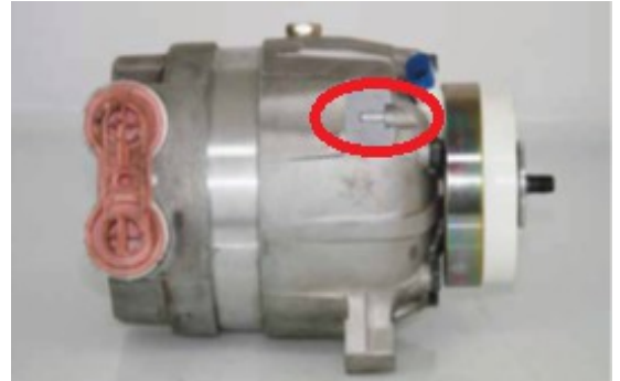
Suport si corp nedeteriorat.