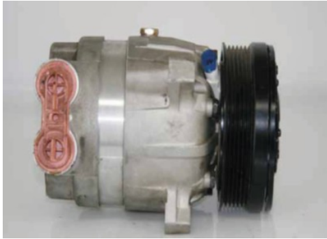
Fara deteriorare mecanica.