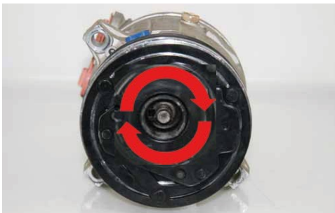
Discul de ambreiaj se in- varte in ambele directii.